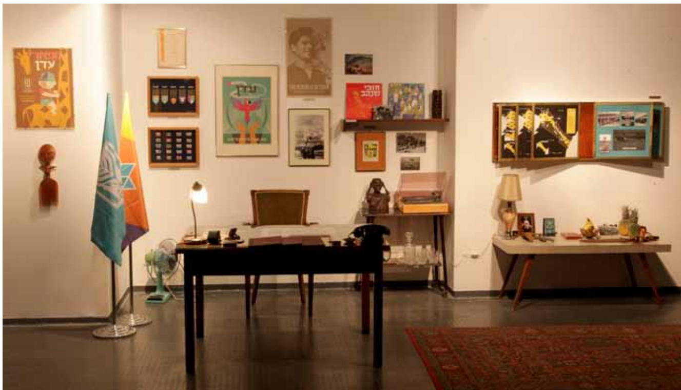
Office of the first Prime Minister of the Republic of Eden, Moshe Dayan.

משרד ראש הממשלה הראשון של רפובליקת עדן, משה דיין