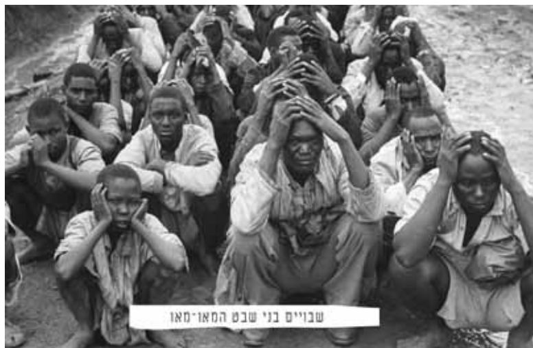
שבויים בני שבט המאו-מאו