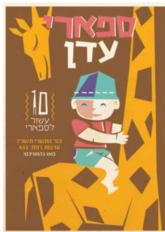
Poster honoring a decade to Eden Safari, trail markings for hikers in the Republic of Eden.

פוסטר לכבוד עשור לספארי עדן, סימון דרך למטיילים ברפובליקת עדן