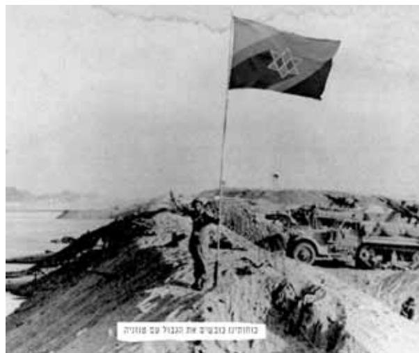
כוחותינו כובשים את הגבול עם סומליה