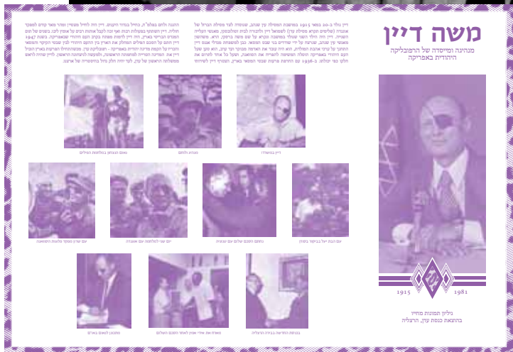
ראש הממשלה משה דיין עם תמונת החוזה המדינה ודגל הרפובליקה