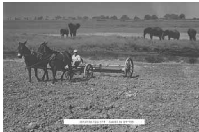
הפועלים של הסוואנה - חלוצי שבט המאו-מאו

Republic of Eden forces capturing the border with Tanzania, prisoners of war from the Mao-Mao tribe, blooming the savanna - a pioneer working the land, and the Kinneret coconut.