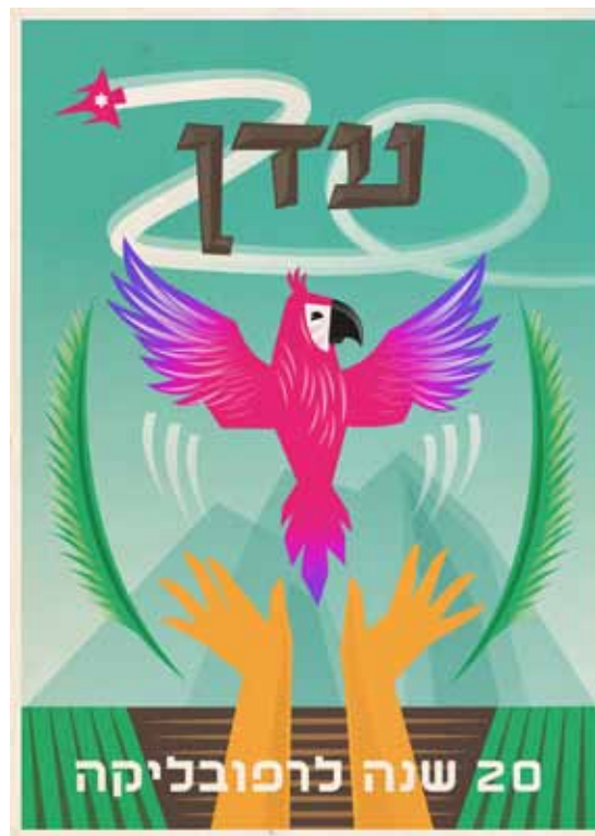
Poster honoring 20 years to the Republic of Eden and stamp of the republic.

פוסטר לכבוד 20 שנה לרפובליקת עדן, חותמת סמל הרפובליקה