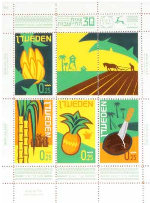
Stamps commemorating 30 years of settlement in the Republic of Eden, and the Republic of Eden flag.

בולים לכבוד 30 שנה להתיישבות בעדן, דגל רפובליקת עדן