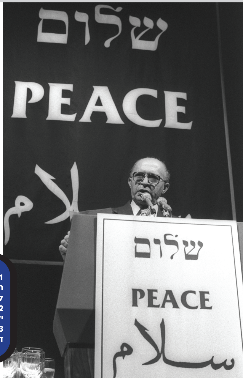
בגין נואם מול עצרת יהודית במרכז לינקולן בניו-יורק, 28/3/1979