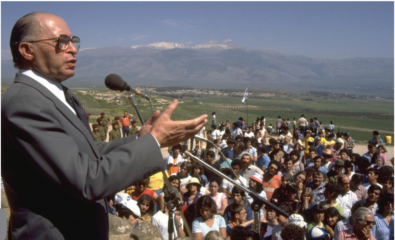
בגין נואם בתל- חי, 16/03/1981

"ובשאתנו את שאיפת ריכוז האומה, אל נחשוש להפנות עיננו גם לגולה, שבה אפשר למצוא גילויים אופייניים ל"גולה נורמאלית". גם גולה זו עשויה לתת מליונים אזרחים למולדת העברית... הם ברובם לא יעזבו שם תנאי עוני... ובבואם אלינו לא ימצאו חיי אמידות. הם אינם עומדים לפי שעה בפני נגישות חמורות. בפני נישול מכון. אין כל בוושה להודות, כי כל הגורמים האלה מילאו ויוסיפו למלא תפקיד גדול בתהליך ההיסטורי של ריכוז האומה... אך ילא על הזהב לבדו יחיה האדם, אין ספק כי לא מעטים הם היהודים גם "בגולה הנורמאלית", שהיו מוכנים, לפחות למען נפש בניהם, לוותר על דברים מסוימים שיש להם בשטח החומרי בתוך עולם חומרי תמורת דברים מסוימים, בשטח הנפשי, שהם יכולים לקבלם אך ורק בעולמה של חירות לאומית".