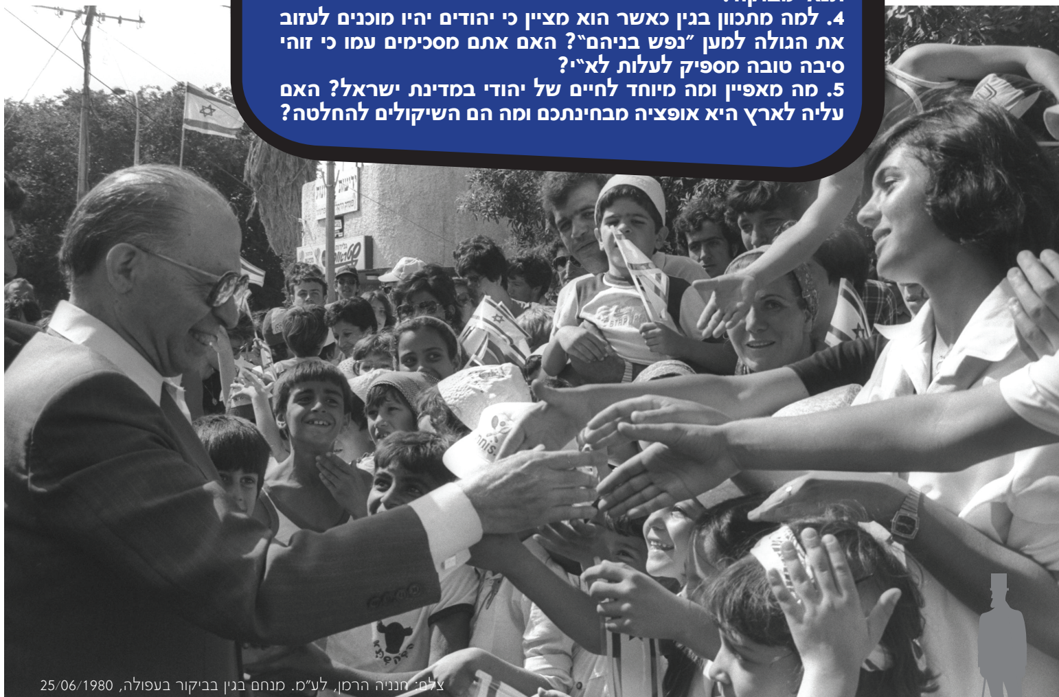
מנחם בגין בביקור בעפולה, 25/06/1980